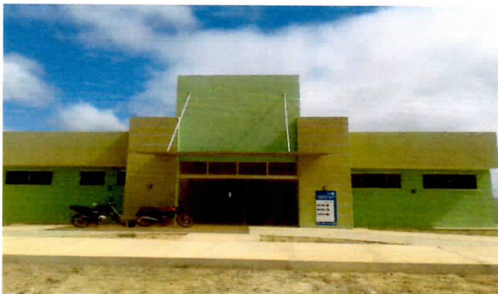
FIGURA 04 – Unidade Básica de Saúde da Serra da Lagoa (concluída).

Essa obra encontra-se totalmente concluída e já foi entregue à população, cuja inauguração aconteceu no dia 14 de março de 2020. Desde então, o prédio recebe equipes de saúde que oferecem o atendimento básico em saúde àquela comunidade rural e adjacências.