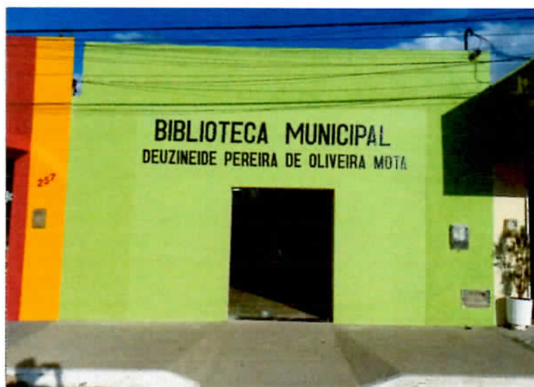
FIGURA 01 – Foto da nova Biblioteca Municipal

No cenário da educação, além da aquisição de novos mobiliários escolares diversos investimentos como forros e aparelhos de ar-condicionado nas salas de aula e material e fardamento escolar para os estudantes, ainda reconstruímos a nova Biblioteca Municipal.